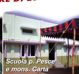
Scuola p. Pesce e mons. Carta