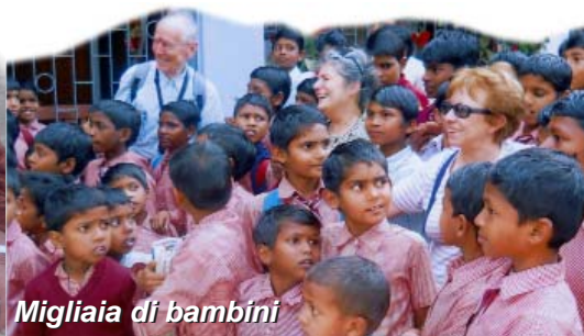
Migliaia di bambini