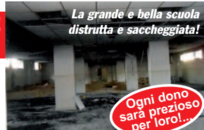
La grande e bella scuola distrutta e saccheggiata!

In Siria l'emergenza continua. Da Damasco sr. Fida Chaya ci scrive: «Viviamo in costante tensione! Oltre la metà dei genitori dei nostri alunni ha perso il lavoro, altri si sono rifugiati presso parenti o amici, in fuga dai quartieri martoriati dalle granate. Sono arrivate famiglie da Maaloula, da Homs e da Aleppo. Quanti morti, quante angosce da condividere, quante lacrime da asciugare sui volti delle vedove, degli orfani! La nostra comunità sta cercando di aiutare tutte le famiglie in lutto, impoverite e disperate. La nostra vecchia scuola. È stata saccheggata e, in gran parte, distrutta... Con il cuore lacerato, ci chiediamo: "Perché... come siamo arrivati a questo?". Nella nostra nuova precaria scuola accogliamo tanti bambini gratuitamente. Organizziamo anche feste e giochi per alleviare in loro i traumi di guerra. Cari amici del Gruppo India, vi ringraziamo calorosamente per le vostre generose donazioni, nella speranza di vedere un giorno tornare la PACE e risplendere la RISURREZIONE sulle rovine delle case e delle chiese dei nostri villaggi e delle nostre città. Con molta riconoscenza vi invio i nostri più cari saluti». Prog. SILI