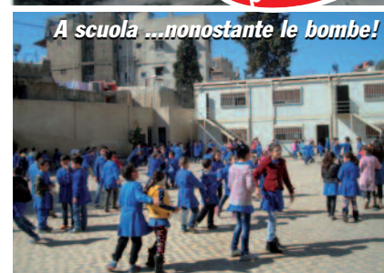
A scuola ...nonostante le bombe!